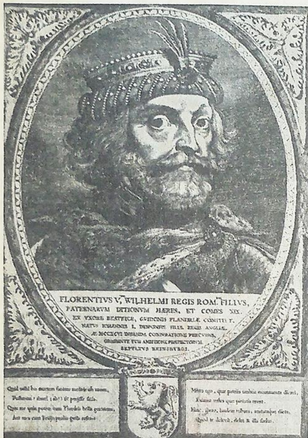
Graaf Floris V, zoals de zeventiende eeuwse Amsterdamse graveur Claes Jansz. Visscher zich hem voorstelde.