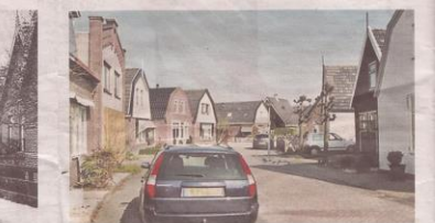
Dezelfde Fabriekstraat, maar dan anno 2013.