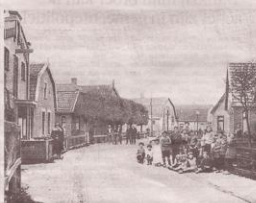
Jongels en meisjes op klompen in de Fabriekstraat, rond 1930.

brak paniek uit, want de sloot was niet ier. Ik bleef zitten. Panastisch locht' dacht ik, want ik voelde me belangrijk. Juh, ik was pas vijf en had helemaal niet door hoe ernstig de situatie was. Toen ben ik wel even streng toegesproken, ja.“ Onderhouden Zij is ervan overtuigd dat veel meer mensen terug gaan in de tijd als ze haar website bezoeken. Een waarheid als een koe. Want een proof op de soms kort dat je zelfs als niet-Warmenhuizer blijft hangen, en van de ene in de andere historische gebeurtenis rol. „Wie Ciske bevoordelen er nog eenkle inkle foto's en anekdotes bij. Volgens mij is er nog verschrikkelijk veel materiaal onder de mensen dat de moeite waard is om bewaard te worden. Hopelijk gaat iedereen die dit leest mij daarmee helpen. Ik ben er in elk geval klaar voor“