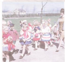
Koninginnedagtocht van de kleuterschool in 1966.