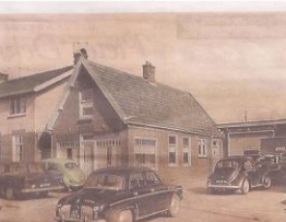
Ondwel 93, rond 1963: garage Rood (laanvoor garage Bakker, nu garage Schipper).